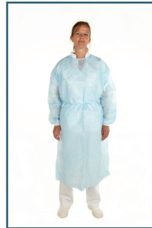
LANGÆRMET VÆSKEAFVISENDE ARBEJDSDRAGT- BESKYTTELSE