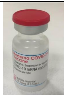
5 mL htgl. med rødt låg